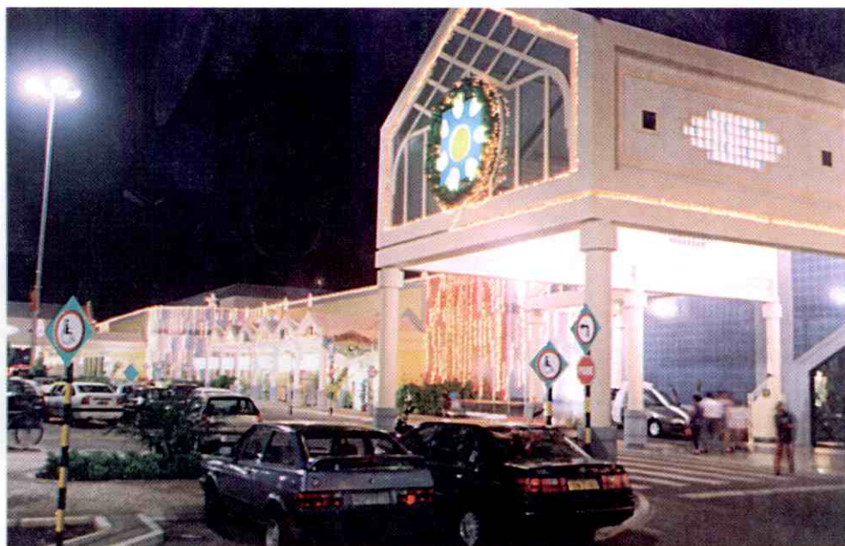
Teresina Shopping: um milhão de lâmpadas na decoração natalina