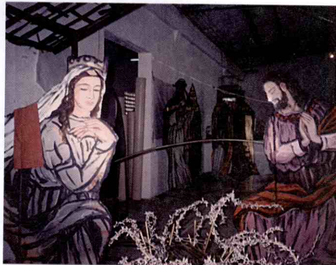
Os presépios terão figuras clássicas