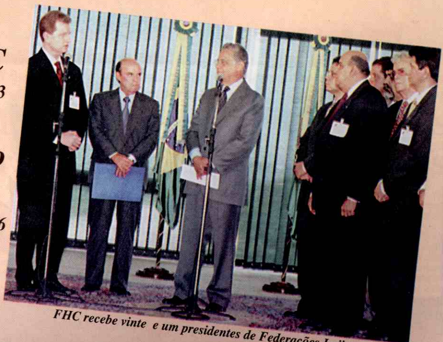
FHC recebe vinte e um presidentes de Federações Lojistas do país