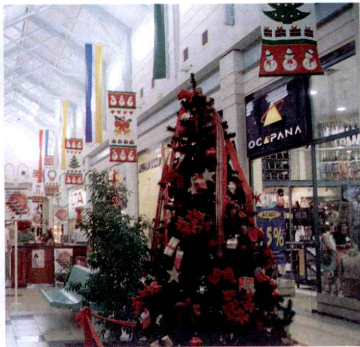
... já receberam decoração de natal

A Fundação Cultural Monseñor Chaves recebe até o dia 10 de dezembro, as inscrições para o concurso natalino de fachadas de casas, lojas e edifícios promovido pela Prefeitura de Teresina, quando serão premiadas as melhores decorações em três categorias.