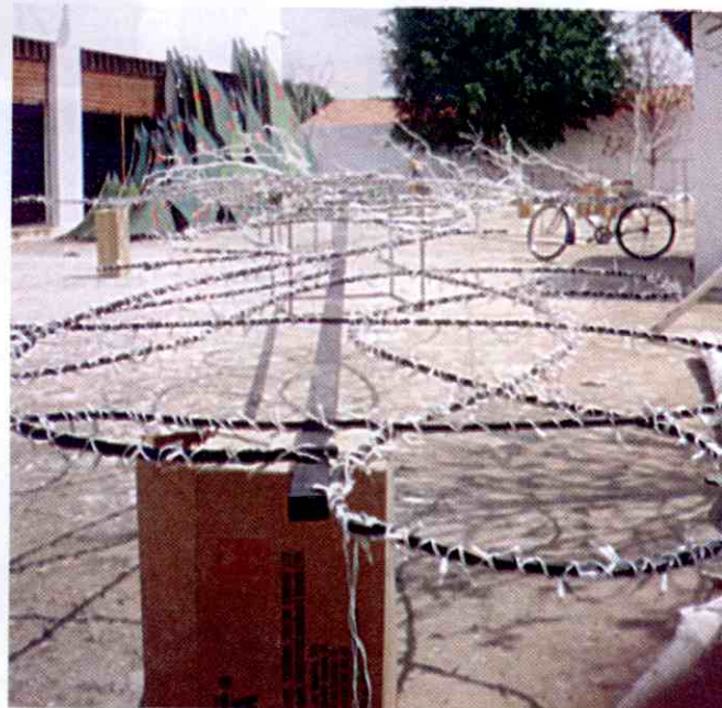
...uma visão da estrutura de ferro usada