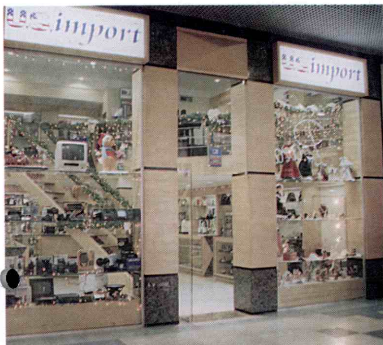
Lojas do Teresina Shopping...