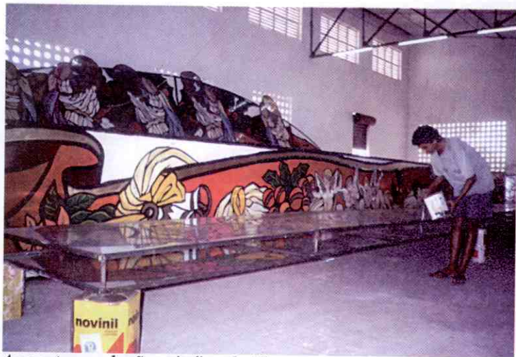
As pontes receberão painéis coloridos