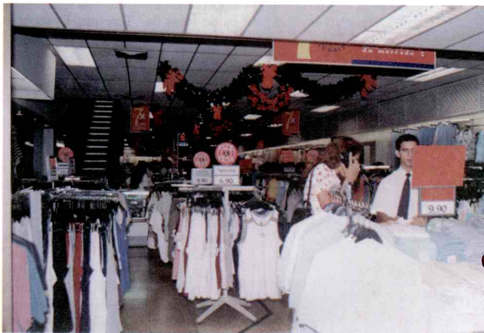
Preços baixos no centro comercial